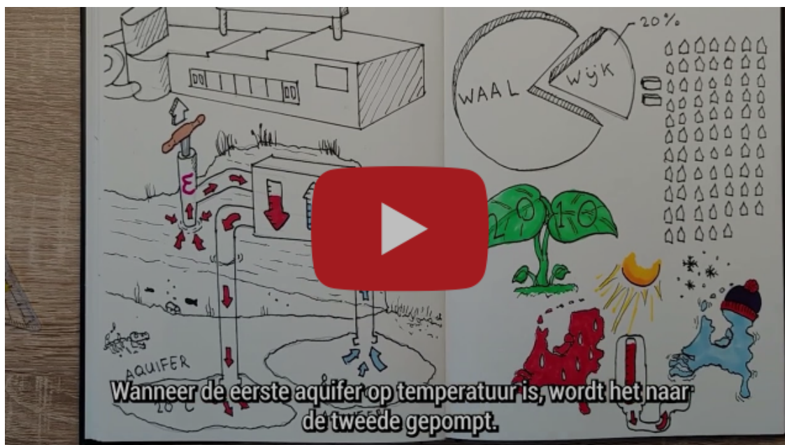
Waalwijkse zwembad Olympia van het gas af