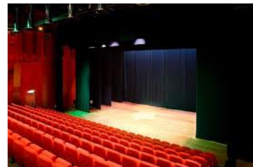
Theaterzaal in het CC Jan van Besouw

Naast de basisinfrastructuur aan culturele voorzieningen is ook het culturele netwerk goed georganiseerd in Goirle: de Contactraad Cultuur Goirle fungeert als cement en zorgt voor ondersteuning van de vele amateurverenigingen en -stichtingen die actief zijn in het kunst- en cultuurdomein. De Contactraad behartigt belangen en is het aanspreekpunt voor de gemeente.