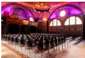
Annetje van Puijenbroekkapel