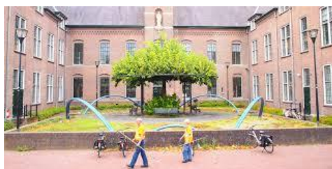
Ingang van de Bibliotheek in het CC Jan van Besouw

Goirle staat ook bekend om haar vele kunst in de openbare ruimte: hier tref je een ruime hoeveelheid kunstwerken aan die worden onderhouden door de gemeente. In 1994 is de percentageregeling kunstopdrachten Goirle vastgesteld door de gemeenteraad welke nog steeds van kracht is. Hierin is bepaald dat 1% van het beschikbare budget voor infrastructurele projecten en bouw of verbouw toekomt aan de kunstzinnige verfraaiing van Goirle, wat zoveel betekent als budget voor beeldende kunstopdrachten. Het beeld voor Ireen Wüst wordt bijvoorbeeld uit deze regeling betaald.