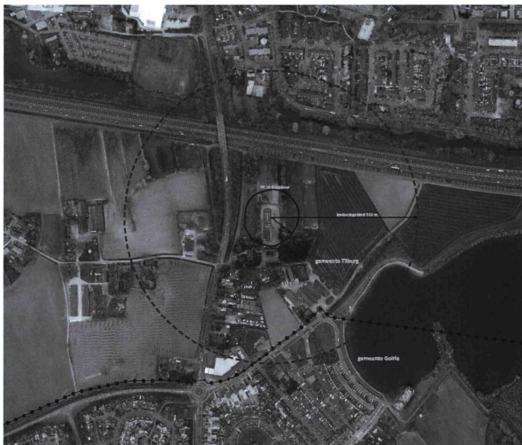
Luchtfoto met in blauw de PR 10-6 contour en in rood het invloedsgebied van Primagaz conform Qra 2008.

De blauwe contour laat het plaatsgebonden risico (voorheen werd dit ook wel individueel risico genoemd) zien (PR 10-6 contour). Binnen deze contour staan nu geen woningen en zijn er ook geen nieuwe kwetsbare objecten (zoals woningen) toegestaan. Beperkt kwetsbare objecten (zoals bedrijfswoningen of bedrijven) wel, indien daar zwaarwegende redenen voor zijn. De rode contour geeft het invloedsgebied 1 weer. Het invloedsgebied is bepalend voor de hoogte van het groepsrisico. Zoals goed te zien is op de luchtfoto is het gebied direct rondom Primagaz niet dicht bevolkt. Pas op grotere afstand liggen woonwijken.