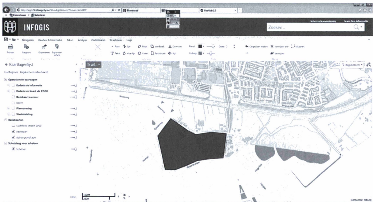
Mogelijk ontwikkelgebied voor woningbouw (rood) in Bakertand,

In het gebied aan de zuidwestelijke zijde van Primagaz (zie onderstaand kaartje) wordt, in relatie tot de beoogde grenscorrectie tussen beide gemeenten, gedacht aan een woningbouwontwikkeling direct grenzend aan woonwijken van Goirle. Het invloedsgebied van Primagaz en de A58 (risicobron) ligt echter over (een deel van) dit gebied. Of hier sprake is van een gewenste ontwikkeling op korte afstand van een risicovol bedrijf en transportas moet nog worden overwogen, dit is vaak gestoeld op andere overwegingen dan externe veiligheid. Vergelijkbaar zijn de ontwikkelingen direct aan de A58 (o.a. de woonwijk in Stappegoor en de uitbreiding van Fontys). Gezien de ligging op korte afstand van de A58 zijn deze ontwikkelingen niet direct positief te noemen voor externe veiligheid, maar op andere aspecten wel. Hetzelfde geldt voor de woningbouwontwikkeling in Bakertand. Vooralsnog wordt er in deze ontwikkeling geen aanleiding gezien om Primagaz te verplaatsen. Natuurlijk zal de woningbouw in Bakertand ontwikkeld worden met oog voor de risico's afkomstig van zowel Primagaz als de A58. Bij de verdere uitwerking van de plannen is dit een belangrijk aandachtspunt. De onderbouwing en afweging van het groepsrisico bij de ontwikkeling van de woonwijk is maakt dit onderdeel uit van het planvormingsproces.