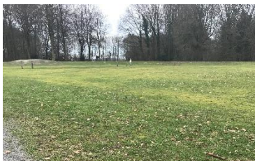
Figuur 3a: traditioneel gazon

Onderstaande foto's geven een impressie van mogelijke veranderingen in het beeld.