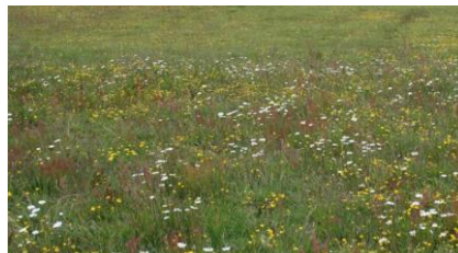
Figuur 3b: kruidenrijk gras, later gemaaid