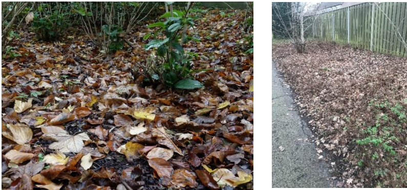
Figuur 4: blad in de beplanting blijft liggen om te composteren