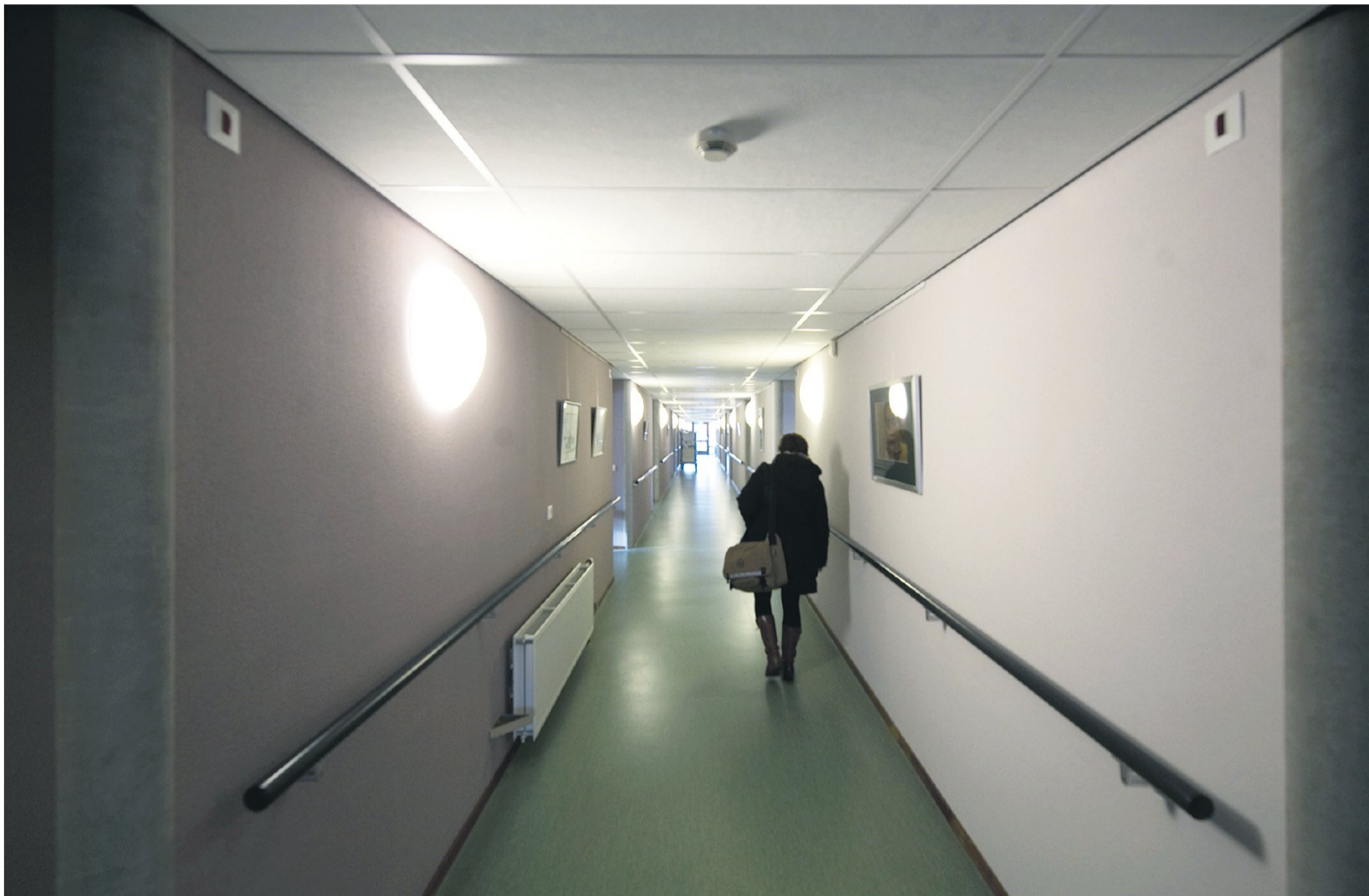
Een medewerker van het veiligheidshuis bezoekt een cliënt. De afdeling Nazorg richt zich op veelplegers die met begeleiding uit de criminaliteit kunnen raken.

Organisaties die in veiligheidshuizen samenwerken, stemmen interventies beter op elkaar af. Volgens onderzoek voor Justitie vergroten de huizen de maatschappelijk veiligheid. Problemen worden eerder gesignaleerd, en er wordt sneller ingegrepen. Minder mensen gaan na een misdrijf opnieuw in de fout. Bij het veiligheidshuis in Tilburg is de recidive sinds 2002 gehalveerd.