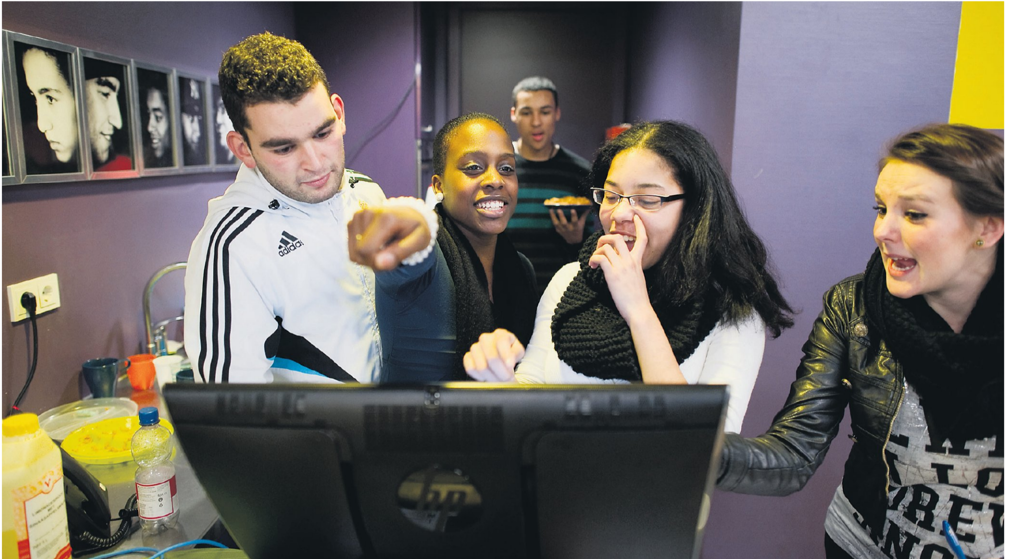
Jongeren maken filmpjes in een studio in buurthuis De Symfonie in Tilburg. Probleemjongeren meldt het buurthuis aan bij het veiligheidshuis.

Organisaties die in veiligheidshuizen samenwerken, stemmen interventies beter op elkaar af. Volgens onderzoek voor Justitie vergroten de huizen de maatschappelijk veiligheid. Problemen worden eerder gesignaleerd, en er wordt sneller ingegrepen. Minder mensen gaan na een misdrijf opnieuw in de fout. Bij het veiligheidshuis in Tilburg is de recidive sinds 2002 gehalveerd.