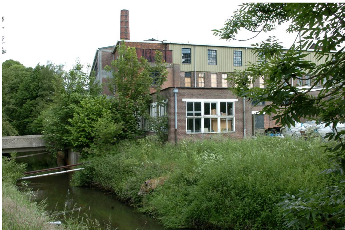
Industrieel erfgoed (Dongen)