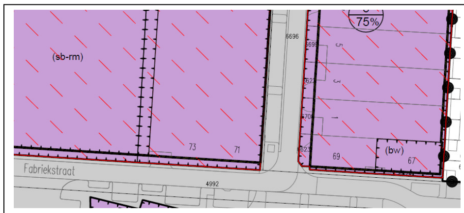
Uitsnede uit het ontwerpbestemmingsplan Bedrijventerrein Tivoort, ter hoogte van nr. 69 ontbreekt de functie aanduiding (bw).

In het ontwerpplan is abusievelijk de bedrijfswoning Fabrieksstraat 69 niet opgenomen. Wel is de naastgelegen bedrijfswoning Fabrieksstraat 67 opgenomen.