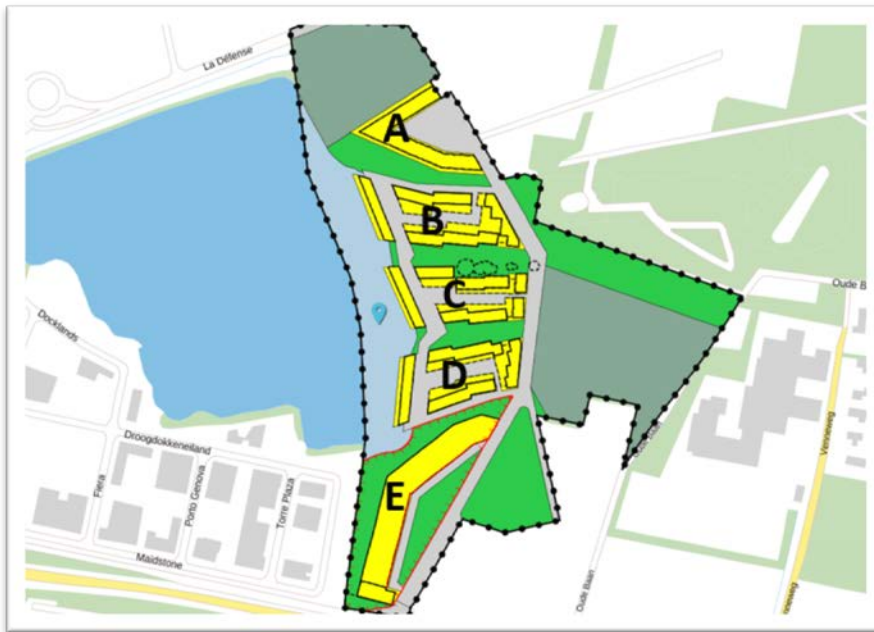
Afbeelding: plangebied met deelgebieden

Onderhavig bestemmingsplan (het plangebied is hieronder weergegeven) is het meest westelijke woongebied en vormt vanaf de bosring een waaier richting het water. De ruimtelijke opzet kenmerkt zich door een open oost-weststructuur die het bos en het water met elkaar verbindt. Deze verbindingen worden gerealiseerd, zodat kleine zoogdieren zich kunnen bewegen van het bosgebied naar de ecologische zone die ten noorden van het plangebied wordt aangelegd.