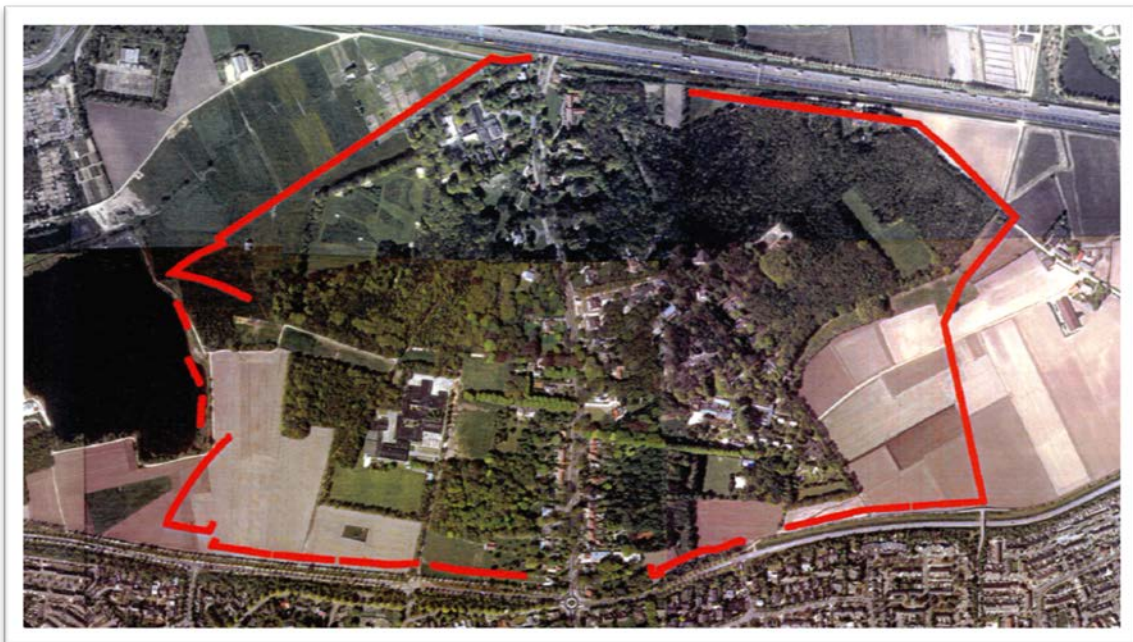
Afbeelding: luchtfoto woongebied "Boschkens"

Het plangebied maakt onderdeel uit van een grote (woon)gebiedsontwikkeling tussen de rijksweg A58 en de bestaande kern Goirle. Het hele woongebied "De Boschkens" dat op onderstaande foto is te zien, is als een ring rondom het bosgebied geprojecteerd en wordt in fases gerealiseerd. Voor de volledigheid worden hierna in het kort ook de overige fases van "De Boschkens" beschreven.