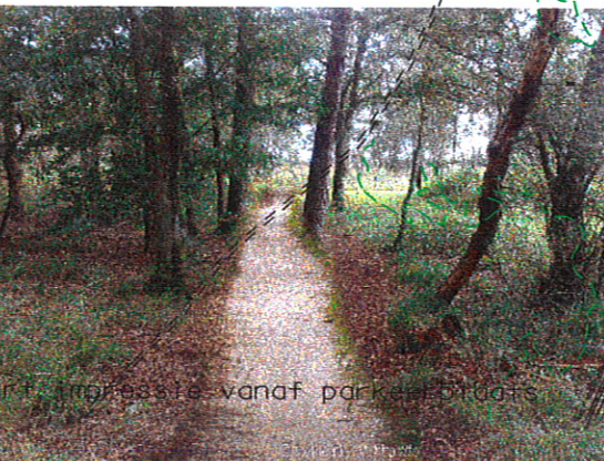
aankomst vanaf parkeerplaats