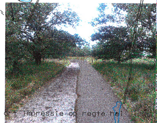
aankomst op de Regte hei