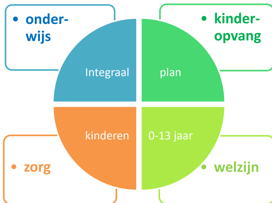
Schema 4.1 Integrale planvorming ten behoeve van kinderen 0-13 jaar

De plannen worden per locatie opgesteld. Dit kunnen de huidige brede schoollocaties zijn, maar het betreft tevens de locaties die nog niet zijn aangewezen als zijnde een brede schoollocatie.