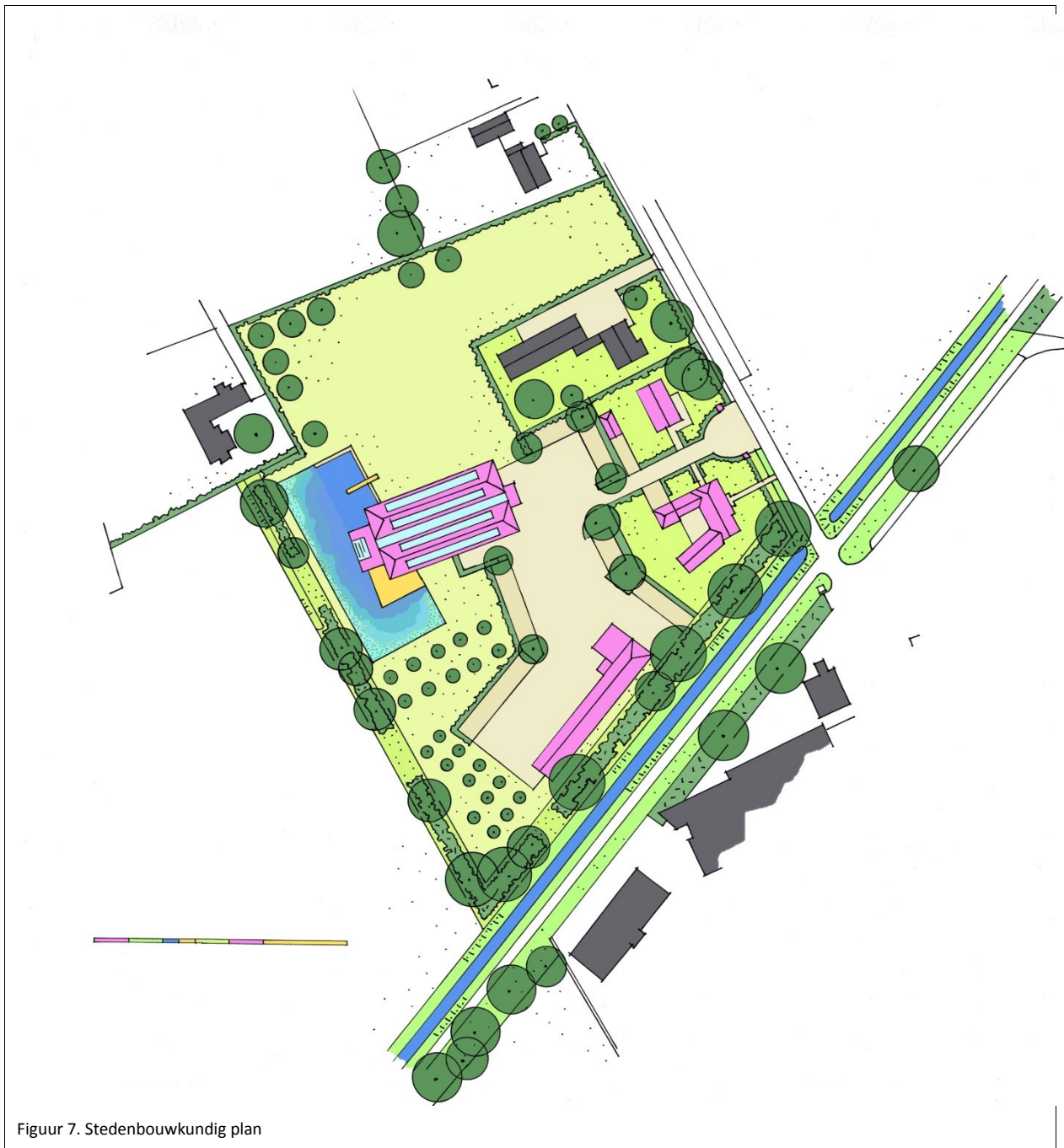
Figuur 7. Stedenbouwkundig plan