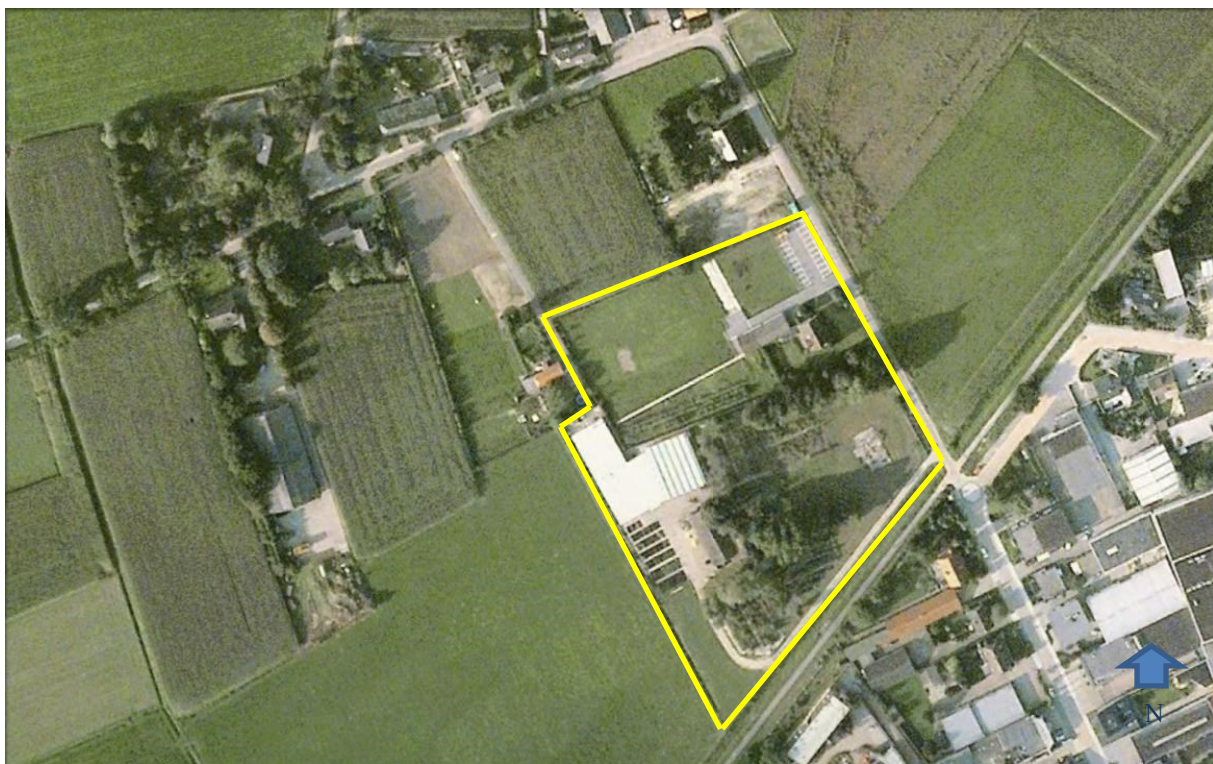
Figuur 2. Plangebied