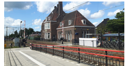
Gilze Rijen Station

Station Gilze Rijen is een spoorwegstation gelegen aan de zuidzijde van de kern Rijen. Het station wordt bemenst door vrijwilligers die optreden als gastheer en-vrouw. Vrijwilligers hebben een prijs gekregen van de NS voor hun diensten, maar tijdens de feestelijke prijsuitreiking bleef het bij een eervolle vermelding. Het stationsgebouw is slecht onderhouden en is een gemeentelijk monument. Het is een a-symmetrisch uit drie bouwdelen bestaand bakstenen utiliteitsgebouw van de NS. Bouwjaar 1915/1916. Door de bemoeienis van Heemschut met dit monument is er een afspraak tot stand gekomen tussen gemeente, NS en Heemschut en is beloofd achterstallig onderhoud eerder te plannen dan de bedoeling was.