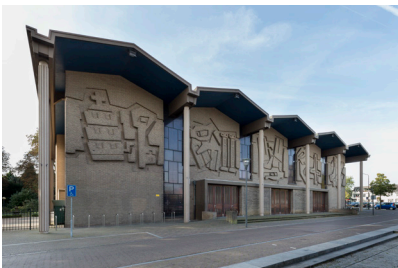
Petrus Bandenkerk in Son