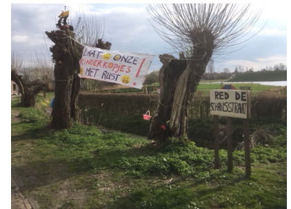
Terheijden - spandoeken

De molen die vrijwilliger wordt gedraaid is tevens een opleidingsmolen voor vrijwilliger molenaars. Heemschut Brabant is benaderd door een vrijwilliger die zich grote zorgen maakt voor de instandhouding van de molen. De eigenaar, de gemeente Rucphen, reageert terughoudend wanneer men wordt aangesproken over de instandhouding van de molen. Uiteindelijk heeft de gemeente ingestemd met een gezamenlijke inspectie afspraak op locatie. De hieruit voortkomende tekortkomingen worden gerapporteerd aan het college van Rucphen