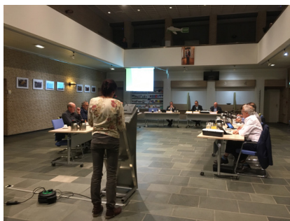
Lid werkgroep bepleid behoud Tantes van Van Gogh (en Van Goghplein)