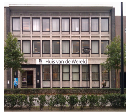
Van Mierlo Bankgebouw

Heemschut Brabant kreeg een melding dat het roze kasteel d'Oultremont (uit het voormalige pretpark Land van Ooit) aan verwaarlozing onderhevig is. Omdat het gaat om een rijksbeschermd monument is de eigenaar verplicht het pand te onderhouden. Een aantal enthousiaste vrijwilligers pakt plannen op om dit terrein op te knappen, maar de gemeente ging hier niet in mee. Eind 2016 wordt bekend dat de realisatie van een diagnostisch medisch centrum met internationale uitstraling op dit terrein van de Poort van Heusden gaat plaatsvinden.