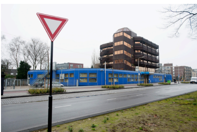
Het Blauwe gebouw Tilburg

Etten- Leur - klooster, internaat: Edward Poppe, Edward Poppelaan 12 Het Internaatgebouw, voormalige Juvenaatsgebouw van Edward Poppe is een naoorlogse pand dat relatief gaaf is, een groot draagvlak voor behoud onder de bevolking kent en in goede technische staat verkeert. Het stond op de nominatie gesloopt te worden. Door gezamenlijke inzet van diverse partijen waaronder Heemschut is in de raadsvergadering van 19 december 2017 besloten het hele juvenaatsgebouw te behouden en te herbestemmen. Hiervoor is door de raad een amendement aangenomen. Dit is ruim een jaar na de presentatie van de eerste plannen, waarin vooral werd uitgegaan van sloop.