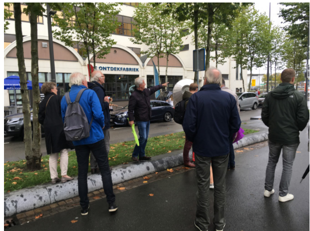
Excursie Strijp S