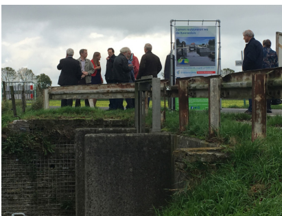
Keenesluis tijdens Nationale Sluizendag