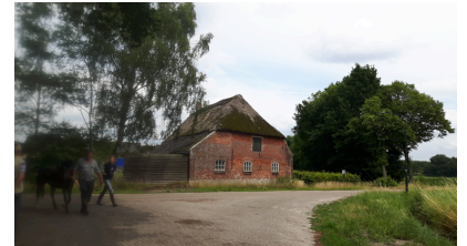
foto Eersel/Vessem. Achterste Donk

Het wijzigen van een bestemmingsplan in cultuurhistorisch gebied. Plan is om vijf nieuwbouwwoningen tegen een middeleeuws gehucht van een tiental compact gesitueerde boerderijen te zetten. Ook het omzetten van twee bedrijfswoningen in burgerwoningen behoort tot het plan. Dit gehucht is gebouwd in een U-vorm en is zeer speciaal. Er is niet op tijd bezwaar ingediend tegen wijzigen bestemmingsplannen en melder vraagt zich af of gemeente niet verplicht moet zijn omwonenden op de hoogte te stellen van wijzigen bestemmingsplan. Het zou wel getuigen van goed bestuur maar verplicht is het niet.