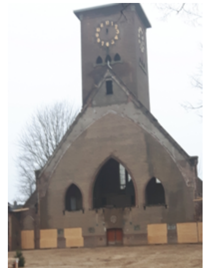
Tilburg - Sacramentskerk