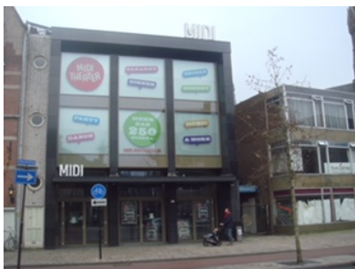
Tilburg - Midi theater