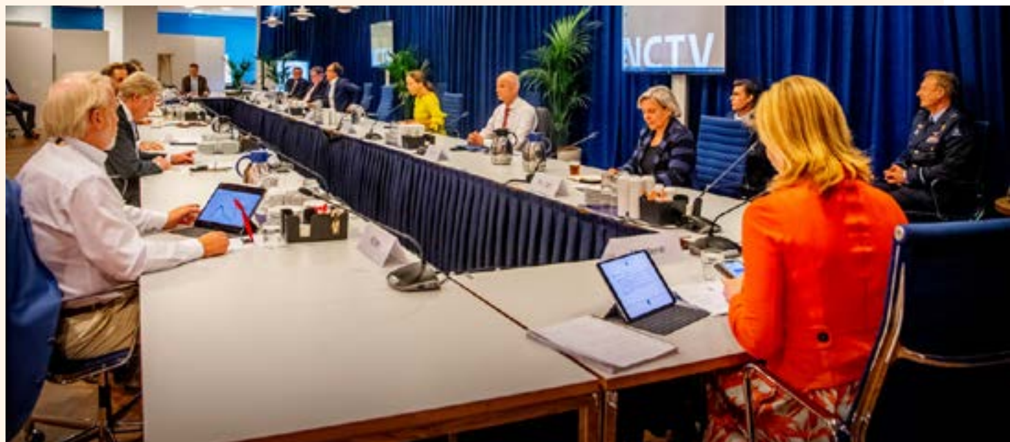
Overleg van de Ministeriële Commissie Crisisbeheersing (MCCb)

Afstemming tussen de districten vindt ambtelijk plaats met behulp van het eerder genoemde projectteam Bevolkingszorg vanuit het principe