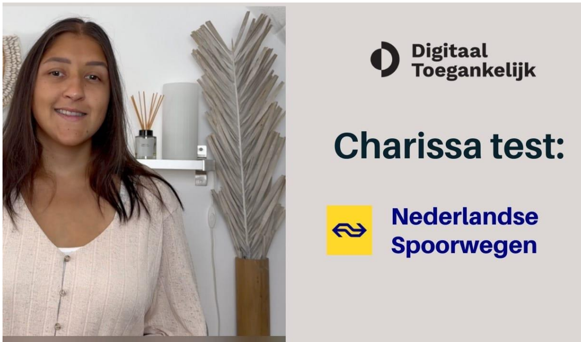
Charissa test: Nederlandse Spoorwegen

In augustus trappen we af met de eerste aflevering: Hoe toegankelijk is de NS app?