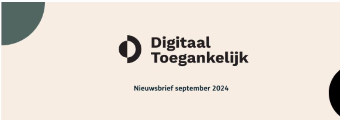
Nieuwsbrief september 2024

In deze multimediale maand test Charissa of ze in de NS app een treinreis kan boeken met een schermlezer. Ook is Annelies te gast bij de podcast 'Met Nerds om Tafel' om te praten over alles wat je moet weten over digitale toegankelijkheid (en waarom je ouders je belastingaangifte niet meer voor je kunnen invullen).