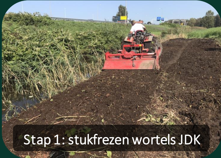
Stap 1: stukvriezen wortels JDK