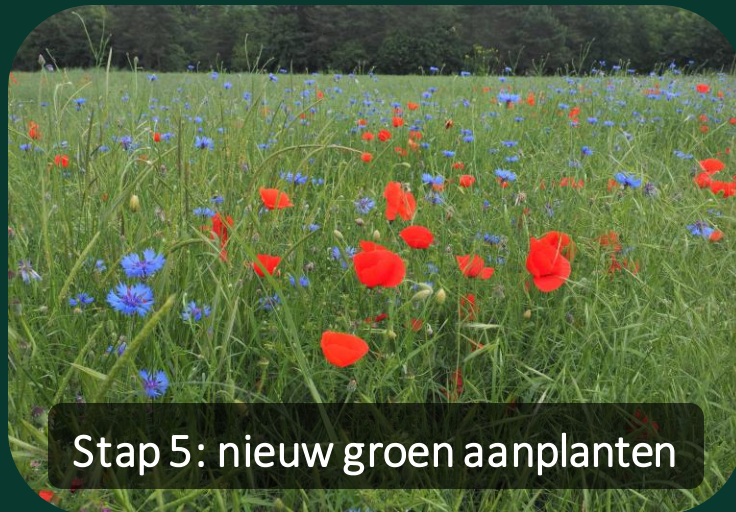
Stap 5: nieuw groen aanplanten