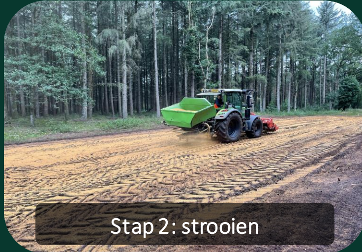
Stap 2: strooien