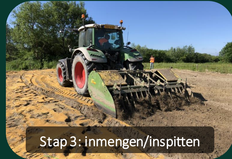
Stap 3: inmengen/inspitten