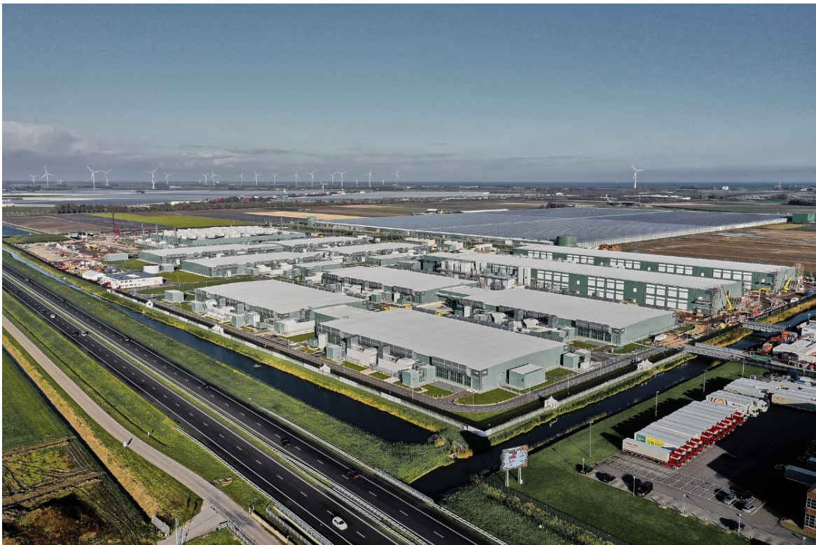
Overzicht situatie Datacenter Middenmeer 70 ha