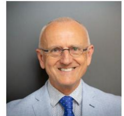
Kees van Rietschoten